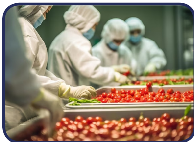
Plantas de alimentos