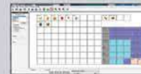
Editor de teclado