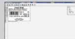
Editor de etiquetas