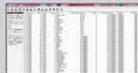
Editor de PLU

Puede controlar todos los datos del programa por CL-Works. CL5000, CL5000J y CL5500 comparten este software con CL5200.